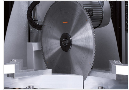
型材加工中心 SBZ 630