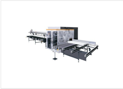
型材加工中心 SBZ 630