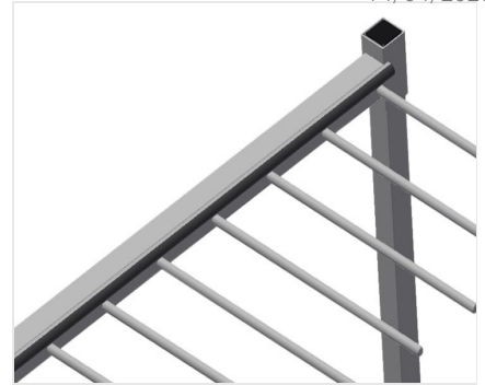
带橡胶条的倚靠装置

隔架高度可以调节。所有的支承面均带有防滑PVC涂层，由此可在存放时避免表面发生损坏。