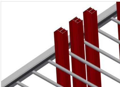
带塑料保护的隔架

隔架高度可以调节。所有的支承面均带有防滑PVC涂层，由此可在存放时避免表面发生损坏。