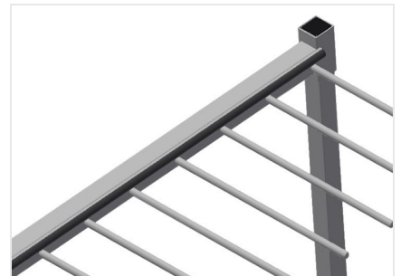
带橡胶条的倚靠装置