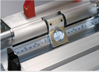
长度定位和测量系统 MMS 100