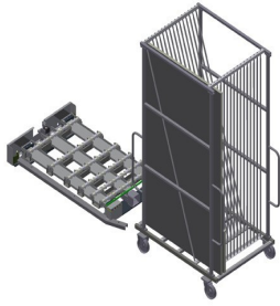
玻璃运输车GFW 15 + 玻璃升降工位GHS 15