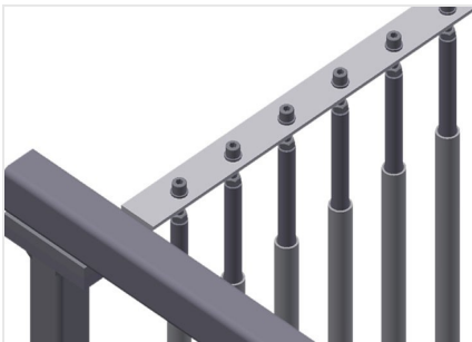
带塑料保护的隔架