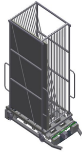
玻璃运输车GFW 15 + 玻璃升降工位GHS 15