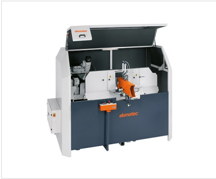
AKS 134/64 + 选装配件