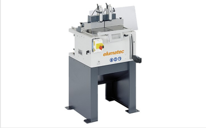
Tablalı Testere TS 161/21