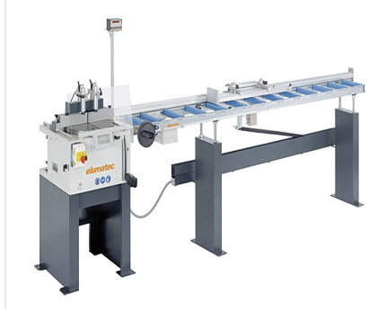
Tablalı Testere TS 161/21 + MMS 200