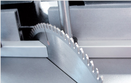
Tablalı Testere TS 161/21