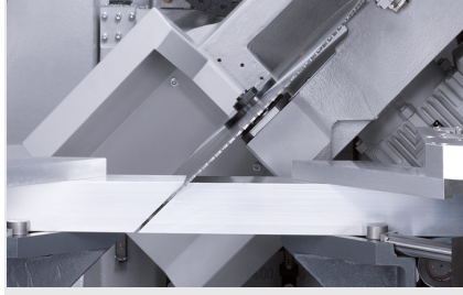
Profil İşleme Merkezi SBZ 631