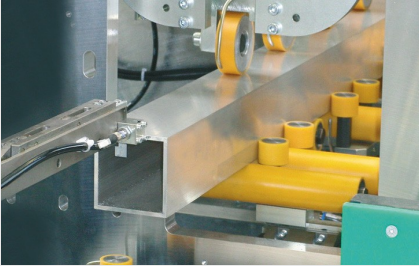
Profil İşleme Merkezi SBZ 631