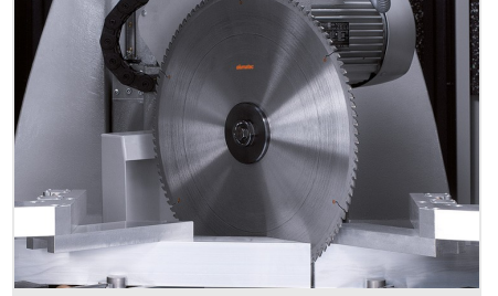
Profil İşleme Merkezi SBZ 631