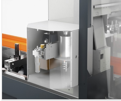
Profil İşleme Merkezi SBZ 141