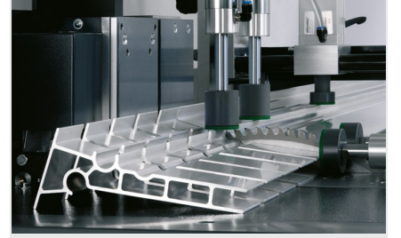
Otomatik Testere SAS 142/44