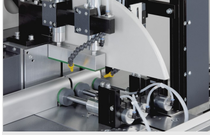
Otomatik Testere SAS 142/44