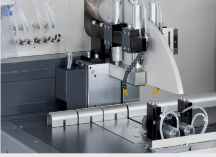
Otomatik Testere SAS 142/44