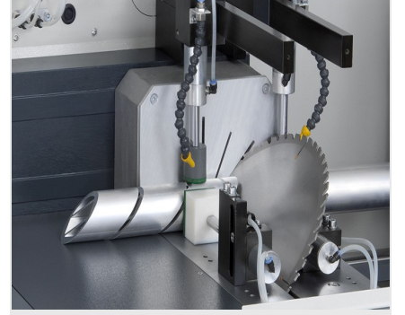
Otomatik Testere SAS 142/43