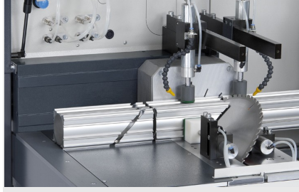
Otomatik Testere SAS 142/43