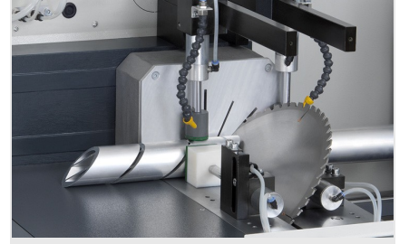
Otomatik Testere SAS 142/43