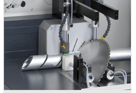
Otomatik Testere SAS 142/43