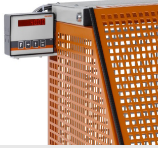
Otomatik Testere SA 73/36