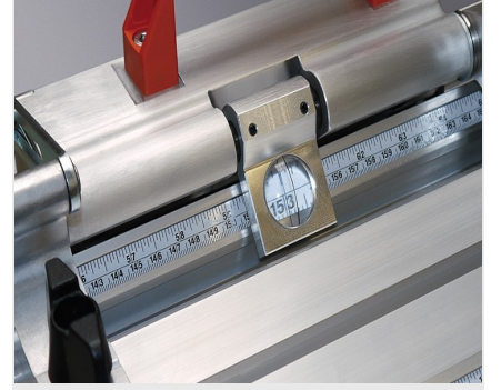
Dayama ve Ölçüm Sistemi MMS 200