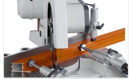
Tek Başlı Testere MGS 73/33