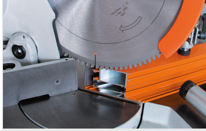
Tek Başlı Testere MGS 73/33