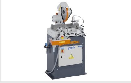
Tek Başlı Testere MGS 73/33