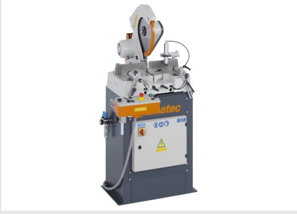
Tek Başlı Testere MGS 73/33