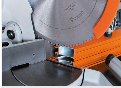
Tek Başlı Testere MGS 73/33