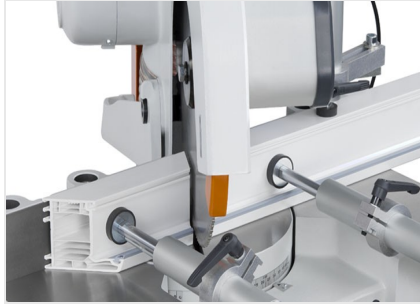
Tek Başlı Testere MGS 73/33