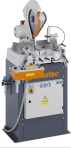
Tek Başlı Testere MGS 73/33