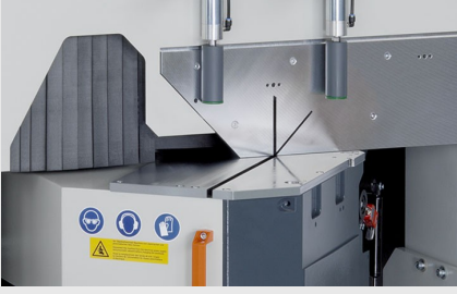
Tek Başlı Testere MGS 105