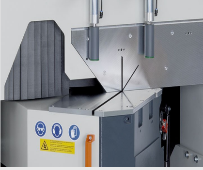
Tek Başlı Testere MGS 105