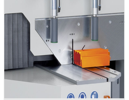
Tek Başlı Testere MGS 105