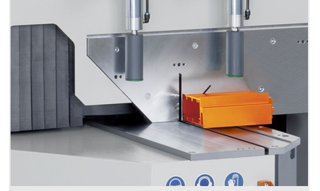
Tek Başlı Testere MGS 105