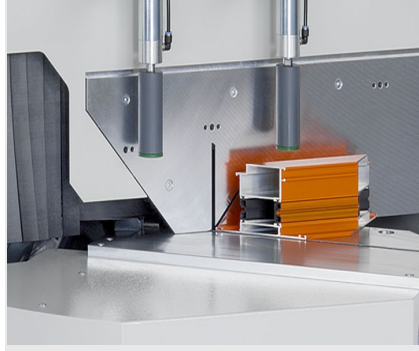
Tek Başlı Testere MGS 105