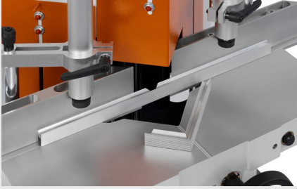
Uç Kesme ve Ayırma Testeresi KS 101/30