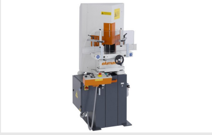
Uç Kesme ve Ayırma Testeresi KS 101/30