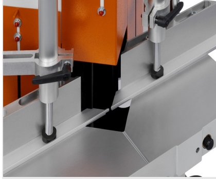
Uç Kesme ve Ayırma Testeresi KS 101/30