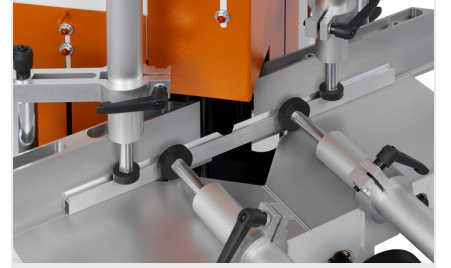
Uç Kesme ve Ayırma Testeresi KS 101/30