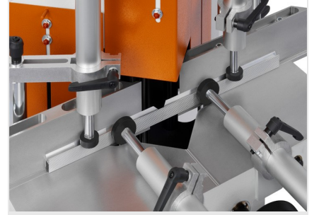
Uç Kesme ve Ayırma Testeresi KS 101/30