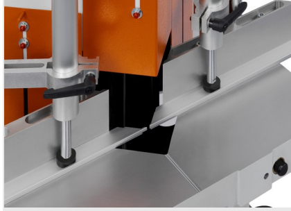
Uç Kesme ve Ayırma Testeresi KS 101/30