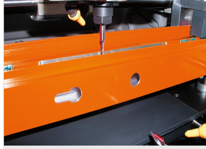
İki Motorlu Kopya Freze KF 78/23