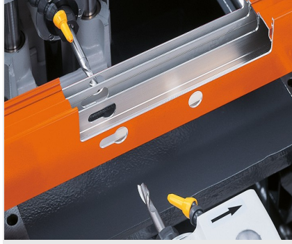
Üç Motorlu Kopya Freze KF 178/10