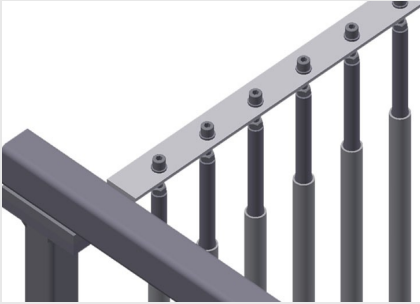
Plastik Korumalı Bölme Bölücü

İki hareketli tekerlek, iki sabit tekerlek sayesinde serbestçe hareket ettirilebilir Hareket makarası çapı 200 mm