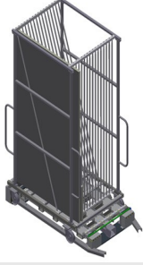
Cam Taşıma Arabası GFW 15 + Cam Kaldırma İstasyonu GHS 15