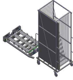
Cam Taşıma Arabası GFW 15 + Cam Kaldırma İstasyonu GHS 15