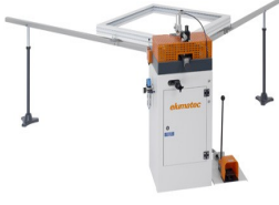
Köşe bağlantı presisi EP 120