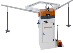
Köşe bağlantı presisi EP 120