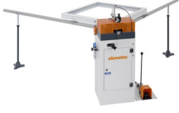
Köşe bağlantı presisi EP 120