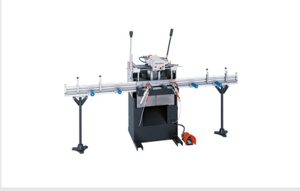
Tek Motorlu Kopya Freze AS 170/10