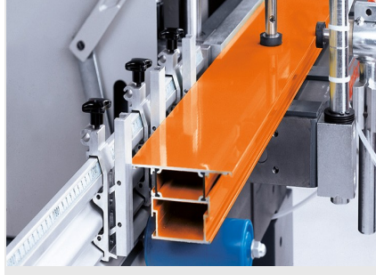
Tek Motorlu Kopya Freze AS 170/10