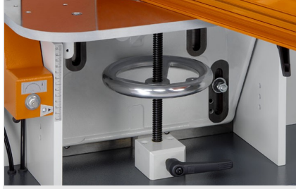
Orta Kayıt Kerme Makinesi AF 223/01