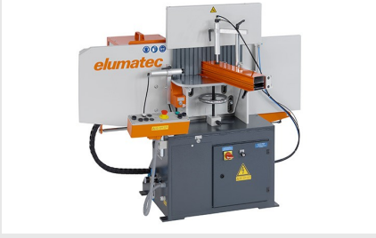
Orta Kayıt Kerme Makinesi AF 223/01