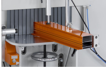
Orta Kayıt Kerme Makinesi AF 223/01