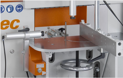
Orta Kayıt Kerme Makinesi AF 223/01