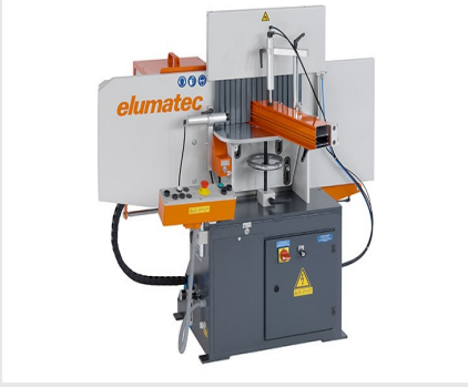
Orta Kayıt Kerme Makinesi AF 223/01