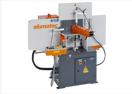
Orta Kayıt Kerme Makinesi AF 223/01