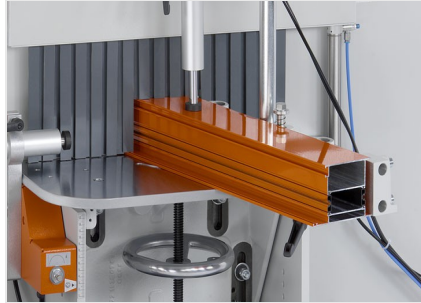
Orta Kayıt Kerme Makinesi AF 223/01