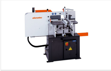
Orta Kayıt Kerme Makinesi AF 222/02