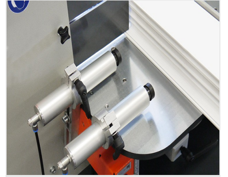
Orta Kayıt Kerme Makinesi AF 222/02