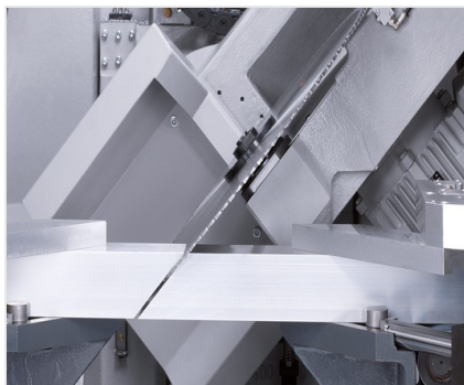
Обработка центр SBZ 631