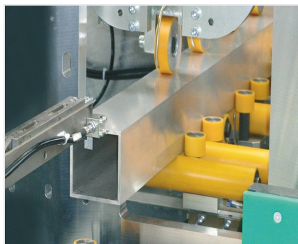
Обработка центр SBZ 631