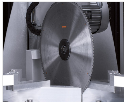
Обработка центр SBZ 631