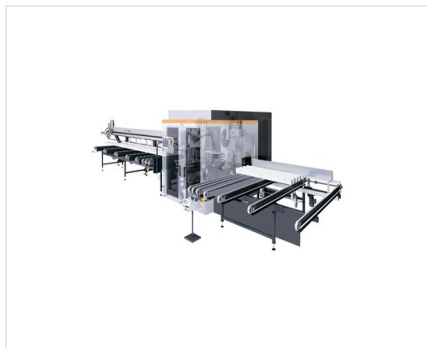
Обработка центр SBZ 631