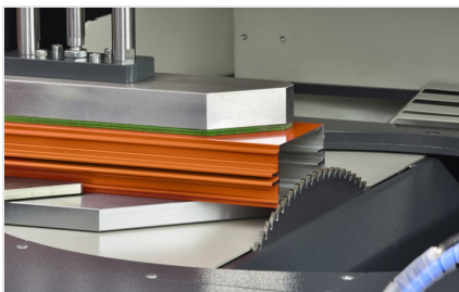
Пильный центр SBZ 616/02