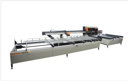
Пильный центр SBZ 616/02