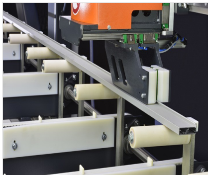
Пильный центр SBZ 616/02