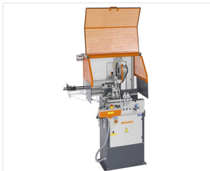
Пильный автомат SA 73/36