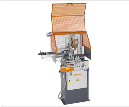
Пильный автомат SA 73/36