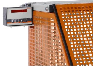
Пильный автомат SA 73/36