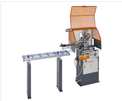
Пильный автомат SA 73/36