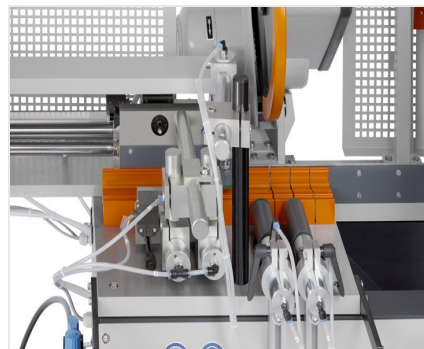
Пильный автомат SA 73/36