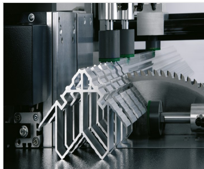
Пильный автомат SA 142/38