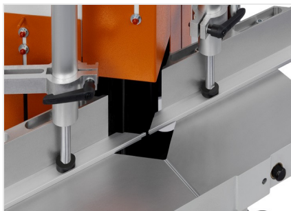
Пила для клиновых и торцевых вырезов KS 101/30