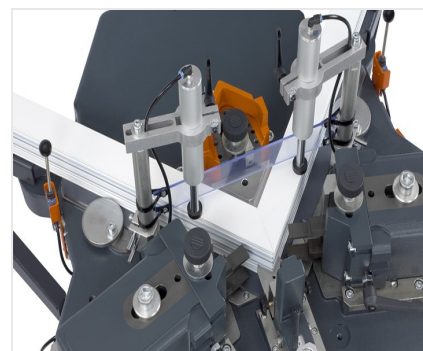
Пресс для стыковки углов EP 124