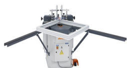
Пресс для стыковки углов EP 124