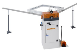
Пресс для стыковки углов EP 120