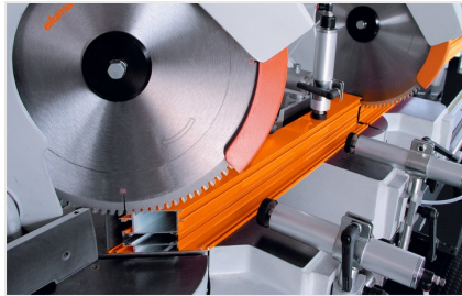
Двойная усорезная пила DG 79