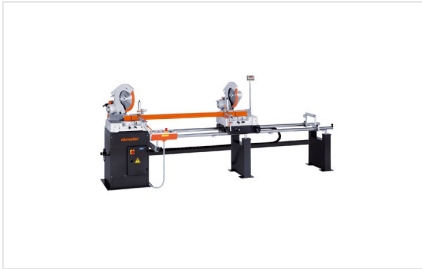
Двойная усорезная пила DG 79