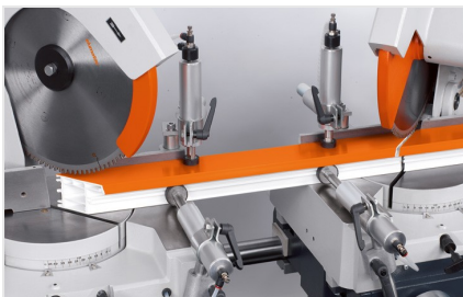
Двойная усорезная пила DG 79