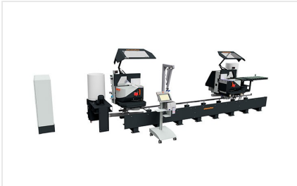
DG 104 Двойная усорезная пила + E 590