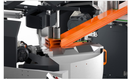
Двойная усорезная пила DG 104