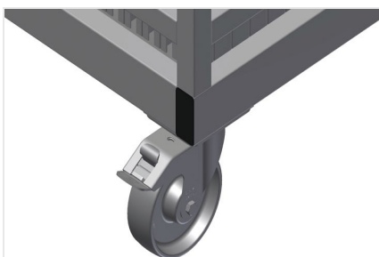
Направляющие ролики в сборе

2 направляющих ролика со стопорным устройством, 2 опорных ролика, за счет этого возможно свободное перемещение, диаметр ходовых роликов 125 мм