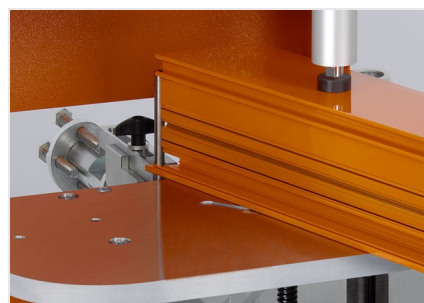
Фрезерный станок для фрезерования торцов AF 223/01