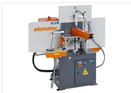
Фрезерный станок для фрезерования торцов AF 223/01