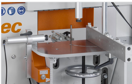
Фрезерный станок для фрезерования торцов AF 223/01