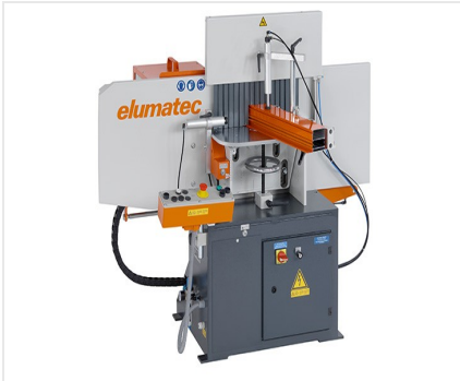
Фрезерный станок для фрезерования торцов AF 223/01