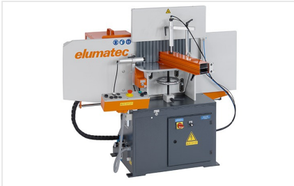
Фрезерный станок для фрезерования торцов AF 223/01