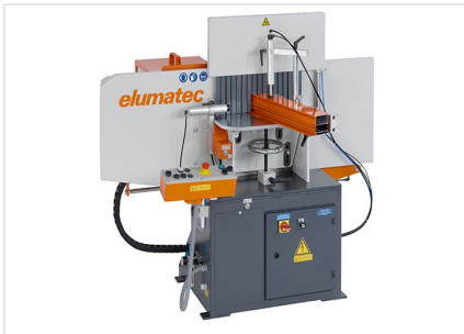
Фрезерный станок для фрезерования торцов AF 223/01