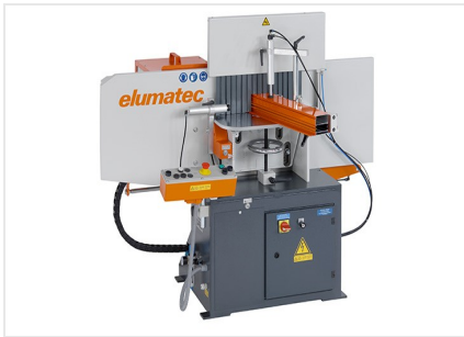
Фрезерный станок для фрезерования торцов AF 223/01