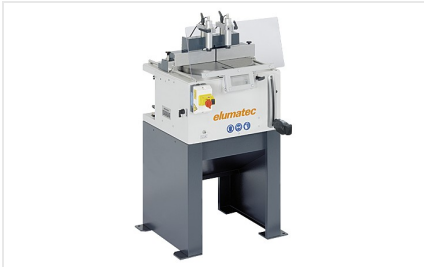
Máquina de corte auxiliar TS 161/21