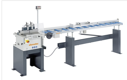
Máquina de corte auxiliar TS 161/21 + AMS 200