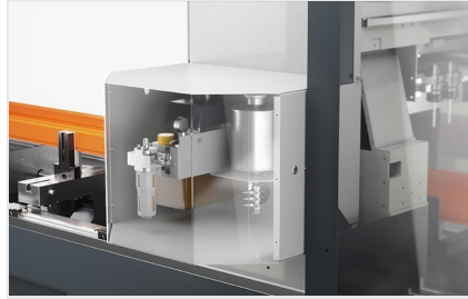
Centro estático SBZ 141