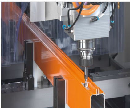
SBZ 140 Centro estático