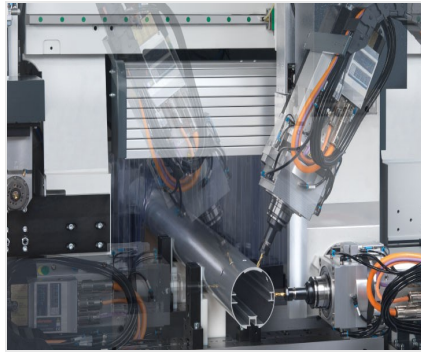
SBZ 140 Centro estático