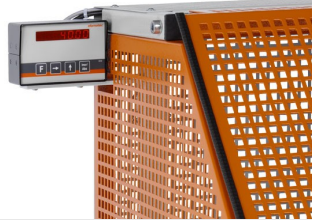
Máquina de corte automática SA 73/36