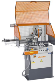
Máquina de corte automática SA 73/36