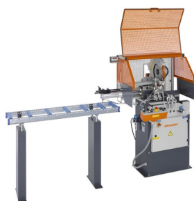
Máquina de corte automática SA 73/36