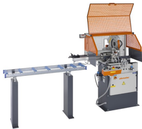
Máquina de corte automática SA 73/36