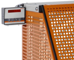
Máquina de corte automática SA 73/36