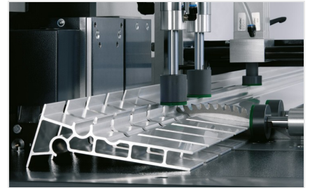
Máquina de corte automática SA 142/38