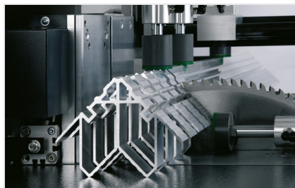
Máquina de corte automática SA 142/38