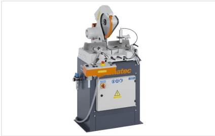
Máquina de corte angular MGS 73/33