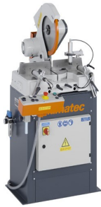
Máquina de corte angular MGS 73/33