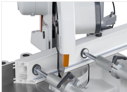
Máquina de corte angular MGS 73/33