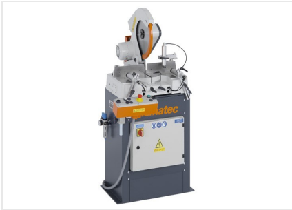
Máquina de corte angular MGS 73/33