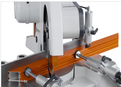
Máquina de corte angular MGS 73/33