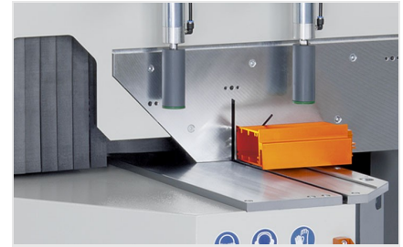
Máquina de corte angular MGS 105